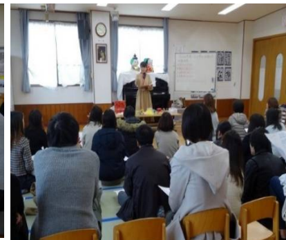
保護者とおもちゃ作りをしました。

お願い 園で使用するタオルが不足しています。未使用で不要な薄手のフェイスタオル(白、ピンク・水色・黄色系)がご家庭にありましたら園にお持ちください。