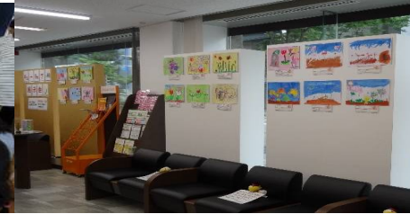
高岡町郵便局で絵を展示して頂きました