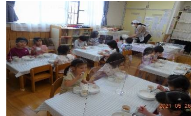
パーテーションをして給食です