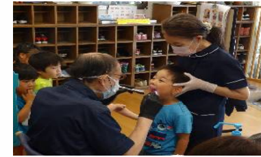
歯科検診をしていただきました