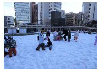
屋上での雪遊びの様子