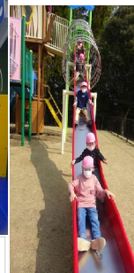
右:アスレチックの滑り台